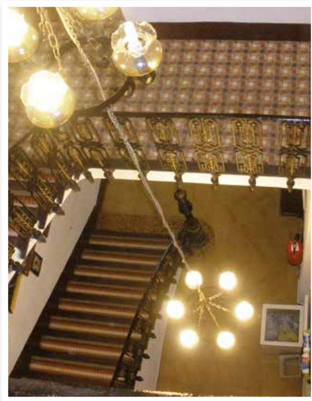
▲ Conjunto de mosaicos Nolla de la escalera de la casa de Tomás Bernabé Gil, actual Sede Social de la Comparsa de Caballeros de Cardona de Sax.

La vivienda ha sido reformada con tal de adecuarla a las necesidades de la asociación festera, conservándose trece mosaicos Nolla. El estudio de los mismos ha detectado doce sencillos y uno tipo alfombra –con un campo central y orla perimetral-. Por otro lado se han documentado once mosaicos formados por teselas monócromas y dos con algunas piezas bicolores, con decoración en encáustica. De los mosaicos documentados destacamos los de la escalera de acceso a la planta principal de la casa que constituyen un ejemplo único hasta ahora en la comarca. También es digno de mencionar el mosaico del salón principal.