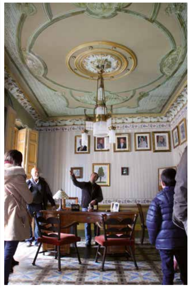
▲ Visitas guiadas a la Sede Social de la Comparsa de Labradores de Villena, una buena forma de poner en valor y socializar el patrimonio disfrutando de sus suelos, paredes, techos y mobiliario histórico.

Revista Especial de Fiestas de Moros y Cristianos