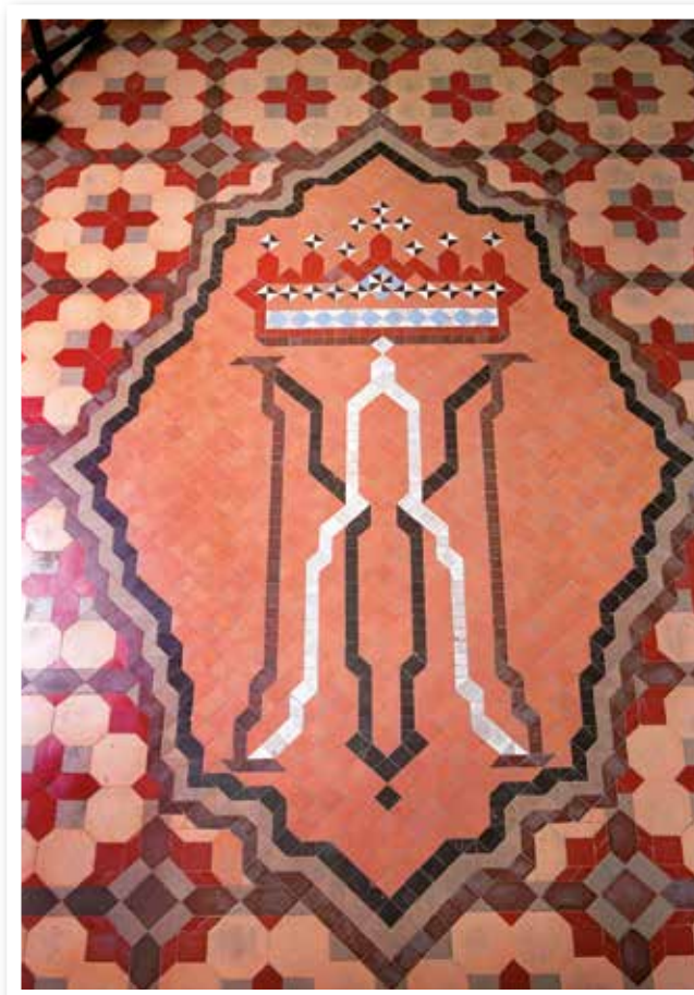
▲ Santuari de la Mare de Déu de Gràcia de Biar. Anagrama del Ave María de la nave central.

el motivo más curioso y elaborado el anagrama del Ave María, formado por una "A" y una "M" con una corona superior situada en el centro de la nave central.