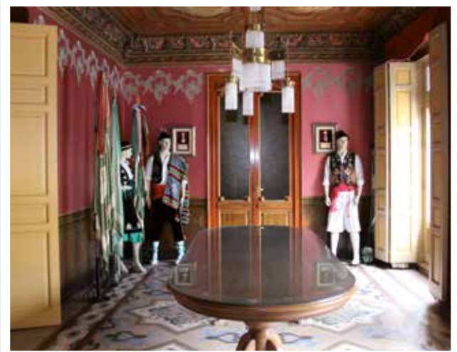
▲ Vista general de la Antecámara de la planta principal de la antigua casa de D. Luis García Catalán, actual Sede Social de la Comparsa de Labradores, donde se conserva uno de los mosaicos Nolla más llamativos de la casa.

destinados. De esta manera, se constituían como pavimentos privativos y de lujo, al ser cada composición única y original, siendo usados para demostrar el poder económico de las familias que los compraban. A su vez, al estar hechos a medida y tener que ser instalados por operarios especializados de la fábrica, su valor, también aumentaba. Todos estos argumentos convirtieron a los mosaicos Nolla en un producto muy solicitado para decorar los ambientes arquitectónicos más distinguidos de la época, con una gran acogida en el ámbito social y financiero de la alta burguesía de la industria y del comercio europeo (Espona, 2016, 194).