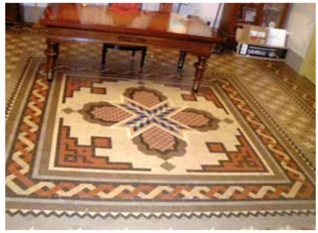
▲ Salón principal de la antigua casa de la familia Gaubert-Alpañés, actual Sede Social de la Comparsa de Moros de Sax.

En este inmueble se han conservado tres interesantes mosaicos Nolla, todos del tipo definido como mosaico “tipo alfombra”, con orla y campo central y todos compuestos por teselas monócromas. De los mosaicos documentados destacamos el del salón principal, con una figura central cruciforme de gran tamaño enmarcada por una orla, un campo central y una segunda orla perimetral.