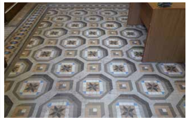
▲ Palacio familia Selva, actual Sede Social de la Junta Central de Fiestas de Moros y Cristianos de Villena. Mosaico Nolla del despacho de la planta baja.

El estudio de los mosaicos Nolla de esta casa determina que de los siete mosaicos detectados hay tres tipo alfombra –con un campo central decorado y orla o cenefa perimetral-, y cuatro sencillos. Y la temática sigue la misma línea ya descrita para la Sede Social de la Comparsa de Labradores, observándose mosaicos con pequeñas teselas monocromas en seis ocasiones y uno con teselas bicolors con decoración encáustica. Precisamente, este último, situado en la antecámara de la primera planta –actual sala de reuniones-, se puede considerar uno de los mosaicos Nolla más interesante y singular de los conservados en la zona, ya que se trata de un diseño exclusivo, no presente en catálogo, y –al parecer-, diseñado in situ a demanda del cliente.